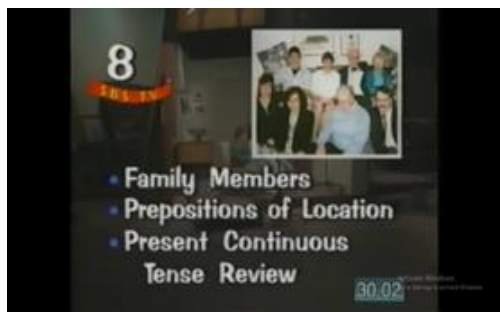
Gambar 3. Materi ketiga video

Ketiga materi video merupakan materi yang ditampilkan saat pelatihan. Para peserta pelatihan diminta untuk menonton satu persatu video tersebut. Video pertama yang diputar tentang daily activities of the native speakers . Para peserta diminta memberikan pendapatnya tentang video tersebut dalam Bahasa Inggris. Ada beberapa peserta yang memberikan pendapatnya dalam Bahasa Inggris. Mereka menjelaskan tentang kegiatan sehari-hari mereka yang sering dilakukan terutama ketika mereka berada di luar sekolah.