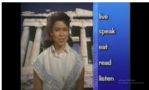
Gambar 2. Materi Kedua Video