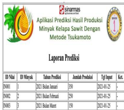
Gambar . Laporan Prediksi Jumlah Produksi

Output dapat dilihat hasil akhir dari pengolahan dan penerapan metode Fuzzy tsukamoto dalam memprediksi produksi minyak kelapa sawit.