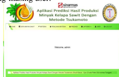
Gambar. Form Menu Utama

Tampilan menu ini berguna untuk memilih daftar entri dan analisa, form menu ini akan di sesuaikan dengan level masing-masing user.