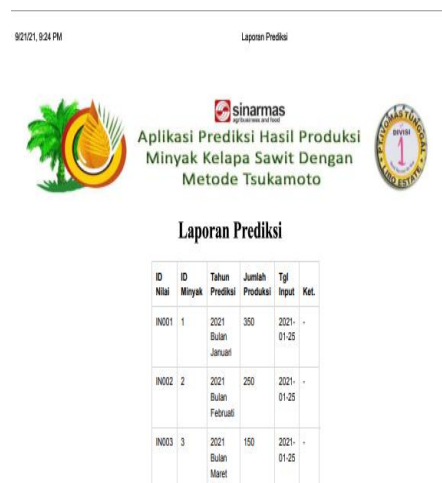
Gambar. Form Prediksi Produksi

Form ini berguna untuk melakukan prediksi dari hasil produksi, berikut ini adalah tampilannya :