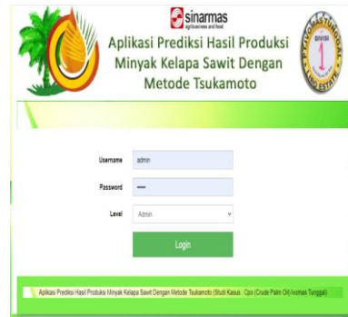
Gambar. Form Login

Form Login Tampilan form ini berguna untuk login pada aplikasi, sebelum masuk ke sistem user di wajib kan untuk login terlebih dahulu.