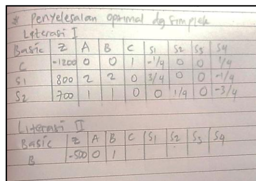
Gambar 2. Kesalahan Prosedural yang Dilakukan Mahasiswa

Pada Gambar 2 terlihat bahwa mahasiswa tidak mampu menemukan titik kunci pada iterasi pertama, sehingga mahasiswa tidak mampu melanjutkan kepada iterasi kedua.