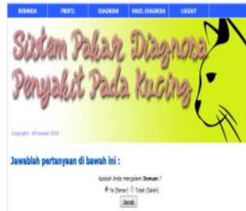
Gambar Tampilan Halaman Diagnosa

Halaman diagnosa merupakan halaman yang menampilkan daftar pertanyaan yang harus dijawab oleh user .