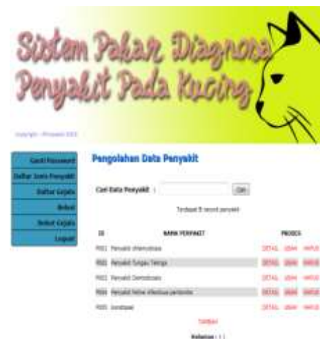
Gambar Tampilan Halaman Daftar Jenis Penyakit

Halaman daftar jenis penyakit merupakan halaman dimana pakar dapat melihat, menambah, mengubah, mencari, dan menghapus informasi tentang jenis penyakit pada kucing