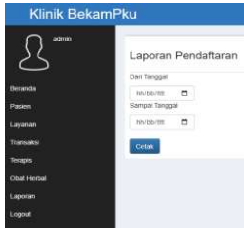
Gambar 8. Tampilan Laporan Pendaftaran

Laporan Keuangan Otomatis Penjualan Herbal: sistem menghasilkan laporan pemasukan harian dan bulanan secara otomatis dari hasil penjualan obat herbal dan bisa di pilih sesuai periode laporan pembayaran yang di inginkan. Tampilan layar laporan pembayaran obat herbal dapat dilihat pada gambar 7.