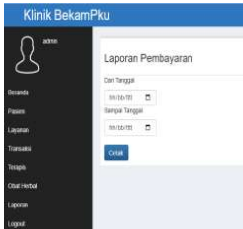
Gambar 6. Tampilan Laporan Pembayaran