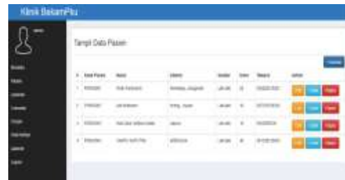
Gambar 3. Tampilan Data Pasien

Manajemen Data Pasien: mencatat data pasien baru, riwayat kunjungan, dan jenis terapi yang dilakukan. Tampilan layar input data baru pasien dapat dilihat pada gambar 3.