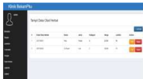
Gambar 5. Tampilan Data Obat Herbal

Manajemen Stok Barang: memantau penggunaan dan ketersediaan obat-obat herbal. Tampilan layar input data herbal dapat dilihat pada gambar 5.