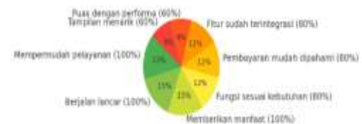
Gambar 10. Hasil User Acceptance Testing

Hasil persentase dari pengujian sistem dengan menggunakan metode User Acceptance Testing (UAT) berdasarkan tanggapan pengguna. Setiap segmen menunjukkan sejauh mana pengguna setuju terhadap fitur atau performa aplikasi dapat dilihat pada gambar 10.