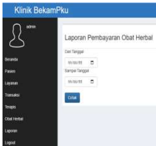
Gambar 7. Tampilan Laporan Pembayaran Obat Herbal

Laporan Keuangan Otomatis Penjualan Herbal: sistem menghasilkan laporan pemasukan harian dan bulanan secara otomatis dari hasil penjualan obat herbal dan bisa di pilih sesuai periode laporan pembayaran yang di inginkan. Tampilan layar laporan pembayaran obat herbal dapat dilihat pada gambar 7.