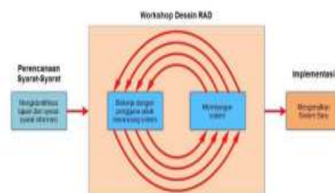
Gambar 2. Tahapan Rapid Application Development (RAD)

Penelitian ini menghasilkan sebuah sistem informasi klinik berbasis web yang dirancang menggunakan metode Rapid Application Development (RAD). Proses pengembangan dimulai dari identifikasi kebutuhan pengguna, analisis sistem, perancangan antarmuka, hingga implementasi dan pengujian sistem. Aplikasi ini dirancang untuk memudahkan operasional harian Klinik BekamPku, khususnya dalam hal pencatatan data pasien, manajemen stok, jadwal terapi, serta laporan keuangan.