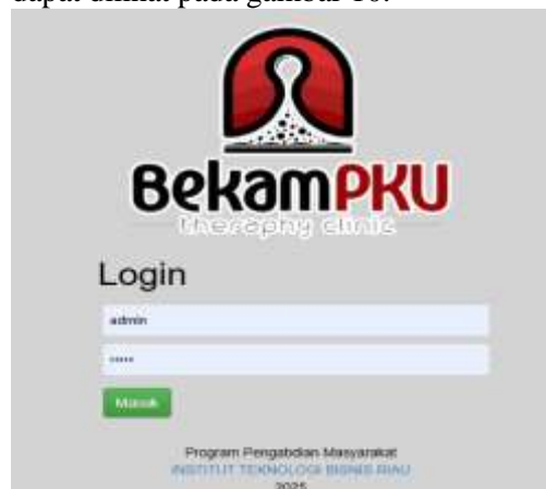
Gambar 10. Halaman Login

Tampilan antarmuka dirancang sederhana dan responsif agar mudah diakses oleh pengguna dari perangkat komputer. Tampilan layar untuk login dapat dilihat pada gambar 10.