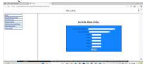
Gambar 7 Data Nilai

Form data nilai berfungsi untuk mengolah data nilai mahasiswa baru