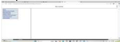
Gambar 2 Form