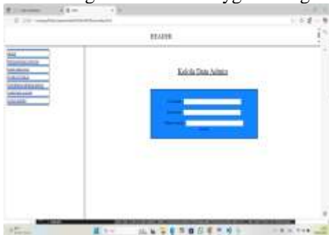
Gambar 9 Kelola Data

Form kelola data admin berfungsi untuk mengolah data admin yg baru login