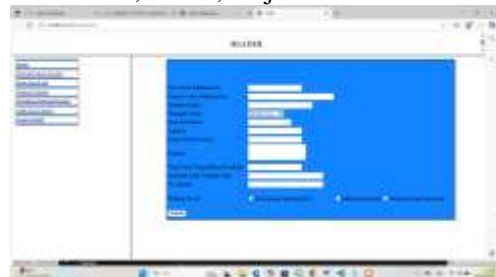
Gambar 5 Data Calon Mahasiswa

Form data calon mahasiswa berfungsi untuk mengolah data calon mahasiswa baru yg terdiri dari nama, no mahasiswa, alamat, no ijazah dll.