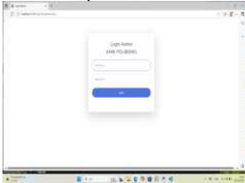
Gambar 8 Login Admin

Untuk dapat mengakses menu admin maka perlu masuk ke form login . Form login berisi tombol-tombol yang dibutuhkan seperti