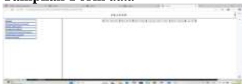
Gambar 3 Form Data