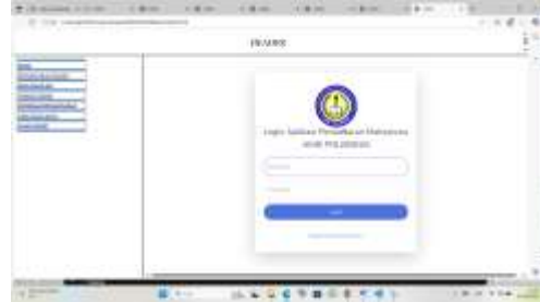
Gambar 4 Form Login Mahasiswa

Untuk dapat mengakses menu utama maka perlu masuk ke form login . Form login berisi tombol-tombol yang dibutuhkan seperti