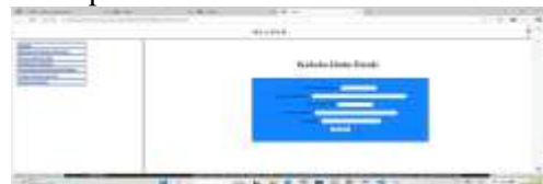
Gambar 6 Data Prodi

Form prodi berfungsi untuk mengolah data prodi seperti nama fakultas, kode fakultas, kode prodi dan nama prodi.