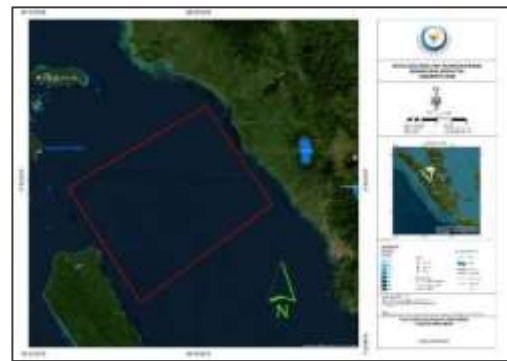
Gambar 1 Peta Lokasi Penelitian

Gambar berikut memperlihatkan lokasi penelitian yang dilakukan di perairan Samudera Hindia, tepatnya di wilayah pengelolaan perikanan Republik Indonesia (WPP RI) 572 yang mencakup perairan Kepulauan Mentawai dan Tiku, Provinsi Sumatera Barat.