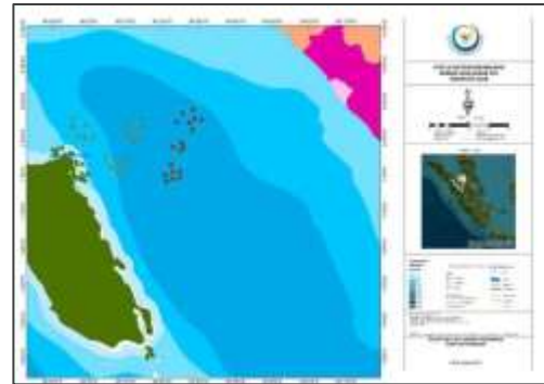
Gambar 3 fishing ground di Pulau Siberut

Waktu yang digunakan oleh nelayan Tiku untuk melaut berkisar antara 7 hari sampai 12 hari. Perbedaan ini terjadi tergantung ukuran kapal (GT) dan banyaknya batu es yang dibawa. Makin jauh melakukan penangkapan makin banyak batu es yang dibawa dan makin besar biaya operasional.