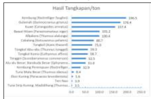
Gambar 5. Grafik Jenis Ikan dan Hasil Tangkapan