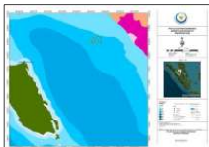
Gambar 2 fishing ground di Tiku

Ukuran perahu bagan yang berpangkalan di Tiku memiliki ukuran dari 10 GT sampai 46 GT. Ukuran armada penangkapan ikan bagan di Tiku banyak yang memiliki perahu bagan yang memiliki ukuran diatas 30 GT. Besarnya ukuran perahu disebabkan oleh kegiatan penangkapan ikan berjarak 72 nautical mil dari pantai Tiku atau 14 jam perjalanan dengan kecepatan kapal 5 mil/jam. Disisi lain keadaan gelombang besar memaksa pengusaha bagan untuk merancang kapal dengan ukuran layak untuk menghadapi gelombang (Suryana et al., 2013). Penangkapan ikan bagan perahu pada bulan Maret sampai April 2024 dapat terlihat pada Gambar 2 dan Gambar 3.