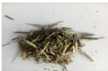
Gambar 5 Hasil Cacahan dengan putaran 1346 rpm