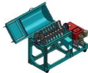
Gambar 2 Desain Mesin Pencacah Pelepah Sawit