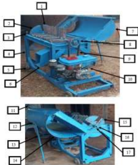
Gambar 4 Mesin Pencacah Pelepah Sawit

Adapun hasil mesin pencacah pelepah sawit dengan menggunakan mesin diesel berkapasitas 7 pk yang telah dibuat dapat dilihat pada gambar dibawah ini :