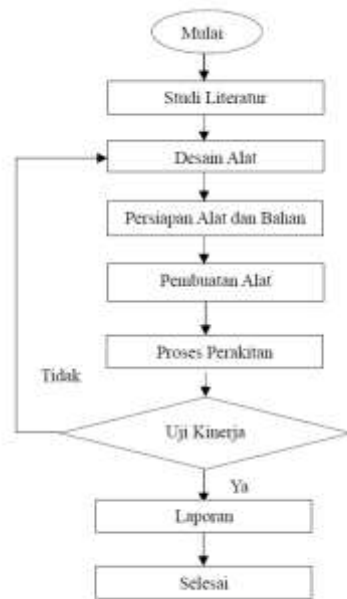
Gambar 1 Flowchart Penelitian

Metode rekayasa meliputi rencana ( plan ), desain ( design ), konstruksi ( construct ) dan penerapan ( applied ). Tahapan – tahapan penelitian meliputi proses identifikasi masalah, proses pengumpulan data, proses perancangan dan proses pembuatan serta proses pengujian mesin. Berikut dijelaskan bagaimana tahapan penelitian sebagai berikut