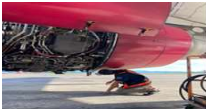
Gambar 10 Bird Strike Pesawat Batik Air

Insiden bird strike juga terjadi di Bandara Internasional Sultan Hasanuddin pada pesawat Batik Air PK-LAY dengan Nomor Penerbangan BTK 6761 Tanggal 2 Desember 2024 pada pukul 16:14 LT pilot melaporkan kejadian Bird Strike kepada ATC sesaat setelah take off . Info dari Teknik A/C terkena bird strike pada bagian engine 2. Pihak maskapai kemudian mengatur penerbangan pengganti. Persoalan tersebut muncul setelah penulis melakukan observasi di lapangan, di mana masih banyak burung yang berada di area sisi udara sehingga mengganggu operasional di Bandar Udara Sultan Hasanudin.