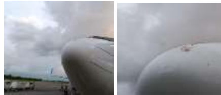
Gambar 1 Gangguan Burung di Bandara

dampak yang signifikan (Dewantari, 2023).