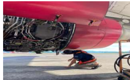
Gambar 2 Bird Strike Pesawat Batik Air

Insiden bird strike juga terjadi di Bandara Internasional Sultan Hasanuddin pada pesawat Batik Air PK-LAY dengan Nomor Penerbangan BTK 6761 Tanggal 2 Desember 2024 pada pukul 16:14 LT pilot melaporkan kejadian Bird Strike kepada ATC sesaat setelah take off . Info dari Teknik A/C terkena bird strike pada bagian engine 2. Pihak maskapai kemudian mengatur penerbangan pengganti. Persoalan tersebut muncul setelah penulis melakukan observasi di lapangan, di mana masih banyak burung yang berada di area sisi udara sehingga mengganggu operasional di Bandar Udara Sultan Hasanudin.