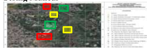
Gambar 11 Pembagian Area Kemungkinan Serangan Hewan Burung