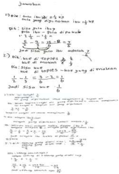
Gambar 2 Hasil Subjek 11

Hasil tes yang dikumpulkan dari Subjek II dapat dinyatakan sebagai berikut: (1) Indikator pertama adalah responden mampu memahami pertanyaan berdasarkan lembar respons. Hal ini terlihat dari kemampuan mereka menjelaskan masalah secara akurat setelah menuliskan informasi yang diketahui dan informasi yang ditanyakan dalam ujian keterampilan pemecahan masalah. (2) Pada indikator kedua, yaitu membuat rencana, peserta menunjukkan tingkat kemahiran yang tinggi dalam menghubungkan informasi yang diberikan dengan informasi yang dibutuhkan.