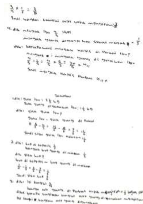
Gambar 3 Hasil Subjek III

Berdasarkan analisis Subjek III yang berada pada kelompok kemampuan rendah, hasil tes yang diperoleh dapat dijabarkan sebagai berikut: (1) Pada indikator pertama, yaitu memahami soal, subjek masih mengalami kesulitan. Pada lembar jawaban yang diketahui, subjek hanya mampu menuliskan sebagian informasi yang diminta dalam soal, tetapi tidak mampu menjelaskan soal secara lengkap, jelas, dan akurat. (2) Pada indikator kedua, yaitu menyusun rencana, kesulitan memahami soal membuat subjek tidak dapat menghubungkan informasi yang tersedia dengan informasi yang diminta. Subjek hanya dapat menyusun rencana penyelesaian untuk soal yang dipahaminya, sementara untuk soal lainnya, ia mengalami kesulitan dalam menentukan rumus yang tepat dan menyusun langkah-langkah penyelesaiannya. (3) Subjek hanya memeriksa soal yang ia pahami dan kerjakan pada indikator keempat, yaitu menginterpretasi hasil yang diperoleh; ia hanya mampu menarik kesimpulan pada beberapa soal, tidak semuanya selesai, yang kemudian dicatat oleh peserta pada lembar tes keterampilan pemecahan masalah. (4) Lebih lanjut, subjek tidak dapat menginterpretasikan hasil yang belum diselesaikan atau dipahaminya.