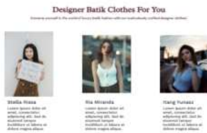
Gambar 3 Fitur Interaktif dan Komponen Ulasan Website Katalog Batik