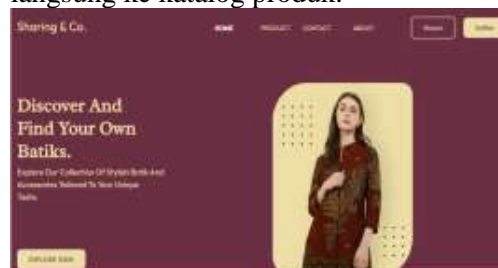
Gambar 1 Tampilan Halaman Utama Website Katalog Batik

identik dengan nuansa klasik Batik. Tipografi serif digunakan untuk memperkuat kesan tradisional, sedangkan tata letak dibuat simetris agar terlihat modern dan profesional. Bagian utama halaman menampilkan hero section dengan gambar model mengenakan Batik dan tombol Call to Action (“Explore Now”) yang mengarahkan pengguna langsung ke katalog produk.