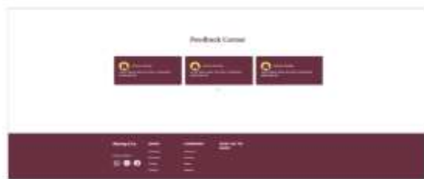
Gambar 4 Tampilan Akhir Desain Website Katalog Batik (High-Fidelity)

Dengan demikian, penggabungan antara unsur tradisional Batik dan teknologi digital dalam desain ini mampu menciptakan pengalaman berbelanja yang modern, efisien, dan tetap mempertahankan nilai budaya.