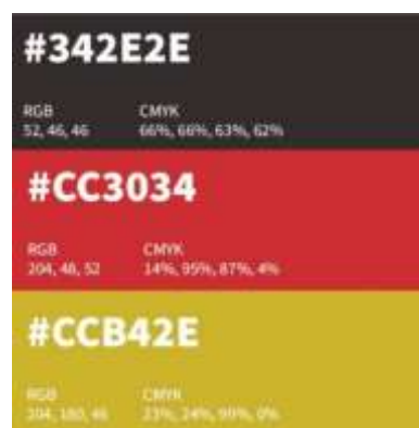
Gambar 4. Color Palette Buku Ilustrasi

Perancangan ini menggunakan warna dalam budaya Minangkabau yaitu bendera marawa yang termasuk warna-warna cerah.