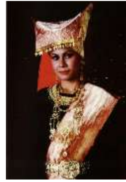
Gambar 7. Referensi Gadis Minang

Perancangan buku ilustrasi tradisi malamang memiliki karakter utama yaitu gadis minang dengan jenis kelamin perempuan. Keputusan pemilihan karakter utama perempuan karena perempuan menjadi peran penting dalam budaya minang yaitu penerus garis keturunan dan adat.