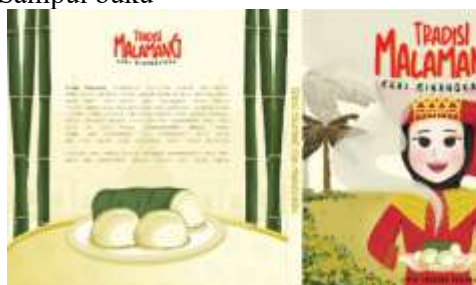
Gambar 3. Sampul Buku

hasil ilustrasi sampul buku yang terdapat gadis Minangkabau membawa makanan malamang hasil dari proses tradisi malamang. penggambaran suasana dipilih untuk menunjukkan lokasi pembuatan malamang yaitu di halaman yang luas. Terdapat elemen pendukung seperti malamang yang sedang dibakar, pohon pisang serta tumbuh-tumbuhan yang dapat menguatkan kesan tradisional yang alami dalam tradisi malamang. Sampul dihalaman terakhir menunjukkan makanan malamang berserta elemen bambu dan rumah gadang yang merupakan ciri budaya asal Minangkabau. Elemen bambu yang digunakan memberi penekanan pada bahan yang digunakan secara tradisional. Terdapat rumah gadang yang menekankan identitas budaya serta memperkuat kesan visual keaslian Minangkabau pada sampul tersebut.