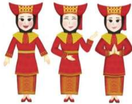
Gambar 7. Karakter Gadis Minang