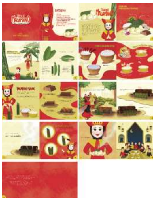
Gambar 8. Alur Cerita Buku Ilustrasi