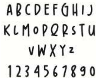
Gambar 5. Font ‘Brownist’

Tipografi dalam buku ilustrasi ini menggunakan jenis font “Brownist” yang digunakan untuk judul dan “modern sans serif” digunakan untuk body text . Jenis font tersebut termasuk font dekoratif dan “modern sans serif” untuk body text . Jenis font tersebut termasuk font dekoratif dan sans serif, yang memberikan kesan modern dan dinamis, namun tetap memperhatikan estetika budaya dan memudahkan pembaca memahami isi informasi dalam buku.