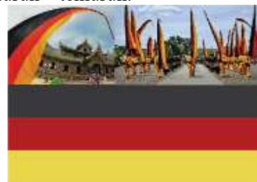
Gambar 1. Bendera Marawa

Penerapan warna yang digunakan dalam perancangan buku ilustrasi tradisi malamang didasarkan pada hasil analisis data melalui wawancara dilanjutkan dengan penelitian serta perancangan terdahulu, dan melakukan pengamatan referensi visual yang diakses melalui internet. Berdasarkan hasil analisis data melalui wawancara di dapatkan warna dalam budaya Minangkabau yaitu bendera Marawa. Warna – warna yang terdapat dalam bendera marawa mencerminkan nilai – nilai kebudayaan yang telah diwariskan turun – temurun.