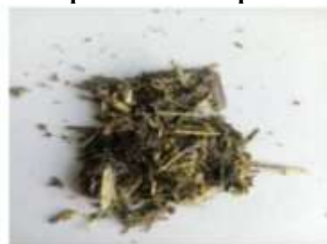
Gambar 6 Hasil Cacahan dengan putaran 1455 rpm

Berdasarkan hasil pengujian mesin pencacah pelepah sawit yang dilakukan pengujian dengan variasi putaran, bahwa pada pengujian dengan mendapatkan hasil yang terbaik yaitu di putaran 1455 rpm, jika dibandingkan dengan hasil putaran di 1346 rpm. Ditinjau dari hasil cacahan dan waktu putaran. Masing masing uji kinerja dilakukan sebanyak 3 kali. Hal ini didukung dari peneliti sebelumnya bahwa metode terbaik untuk mencacah rumput gajah pada kecepatan 1550 rpm dimana dapat menghasilkan 238,1 kg/hour (Wicaksono, dkk). Berdasarkan dari data penelitian dapat disimpulkan bahwa semakin besar rpm mesin yang digunakan maka semakin kecil nilai waktu yang diperlukan untuk pencacahan pelepah sawit dan semakin halus tekstur dari hasil