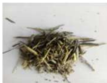
Gambar 5 Hasil Cacahan dengan putaran 1346 rpm