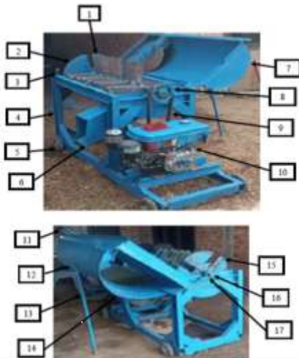
Gambar 4 Mesin Pencacah Pelepah Sawit

Adapun hasil mesin pencacah pelepah sawit dengan menggunakan mesin diesel berkapasitas 7 pk yang telah dibuat dapat dilihat pada gambar dibawah ini :