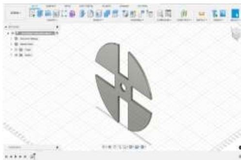
Gambar 5 Desain Dudukan Mata Pisau

Adapun hasil mesin pencacah pelepah sawit dengan menggunakan mesin diesel berkapasitas 7 pk yang telah dibuat dapat dilihat pada gambar dibawah ini :