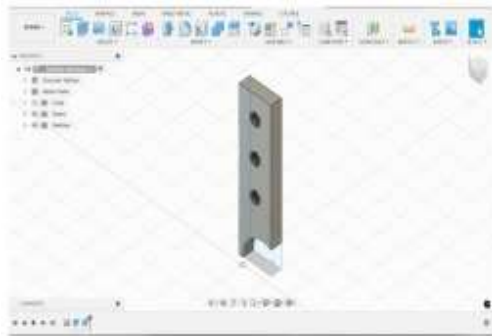
Gambar 4 Desain Peyangga Mata Pisau