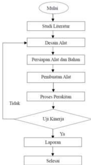
Gambar 1 Flowchart Penelitian

( engineering ). Metode rekayasa meliputi rencana ( plan ), desain ( design ), konstruksi ( construct ) dan penerapan ( applied ). Tahapan – tahapan penelitian meliputi proses identifikasi masalah, proses pengumpulan data, proses perancangan dan proses pembuatan serta proses pengujian mesin. Berikut dijelaskan bagaimana tahapan penelitian sebagai berikut :