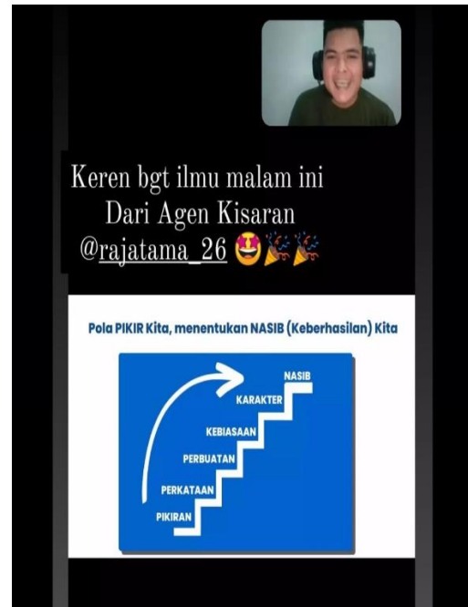
Gambar 1. Pemberian Materi

Dokumentasi kegiatan yang dilakukan melalui zoom meeting ini antara lain: