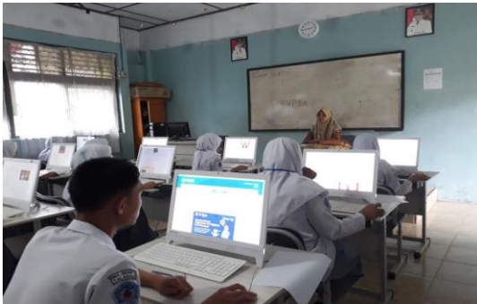
Gambar 3. Pemberian Materi Kepada Peserta