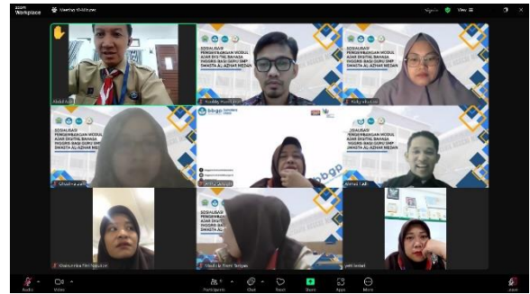
Gambar 3. Sesi Tanya Jawab saat Sosialisasi

Mitra juga merasa sangat tertarik dan menanyakan beberapa hal detail terkait modul ajar berbasis digital yang dipaparkan. Mitra menunjukkan minat dan keinginan yang kuat untuk mencoba membuat modul ajar yang akan disusun bersama tim guru-guru bahasa Inggris.