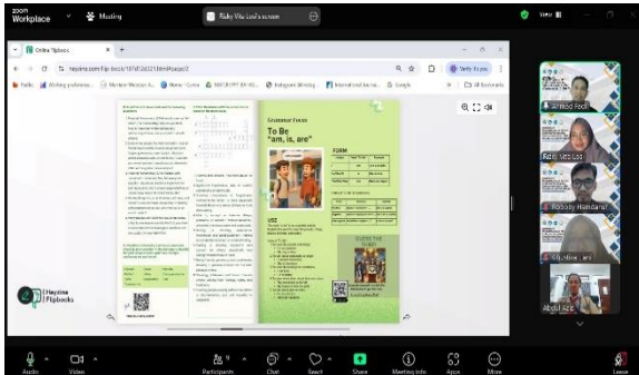
Gambar 1. Pemaparan Materi dalam Sosialisasi Pengembangan Modul Ajar Berbasis Digital kepada Guru-Guru Bahasa Inggris di SMP Swasta Al-Azhar

dalam pembelajaran yang inovatif an interaktif.