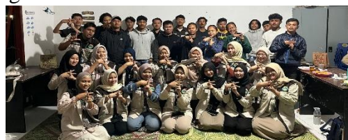
Gambar 6. Sosialisasi Bank Digital dan QRIS

sosialisasi Bank Digital & QRIS . Kedua program ini tidak hanya memberikan pengetahuan baru, tetapi juga membekali masyarakat dengan keterampilan praktis untuk meningkatkan daya saing di era digital.