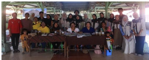
Gambar 4. Edukasi pencegahan stunting dan Pemberantasan kemiskinan ekstrem

bahaya penyalahgunaan narkoba, serta pembiasaan aktivitas fisik secara teratur.