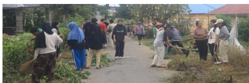
Gambar 9. Kegiatan Gotong Royong

Terdapat dua program utama. Pertama, Ngajibers yang menjadi wadah pembinaan keagamaan sekaligus memperkuat ikatan silaturahmi antarwarga. Kedua, kegiatan gotong royong yang memadukan kepedulian sosial dengan aksi nyata menjaga lingkungan. Kombinasi antara kegiatan keagamaan dan sosial ini membuktikan bahwa nilai spiritual dapat berjalan seiring dengan praktik sosial-ekologis, sehingga masyarakat tidak hanya semakin religius, tetapi juga semakin solid dan peduli terhadap lingkungan sekitarnya.