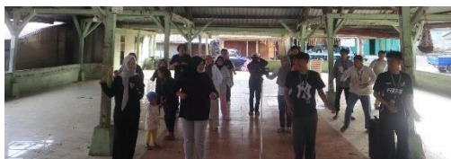
Gambar 5. Kegiatan senam bareng lansia

Terdapat dua program utama di bidang kesehatan. Pertama, Edukasi Stunting dan Gizi Keluarga yang bertujuan meningkatkan pengetahuan ibu rumah tangga mengenai pentingnya menu seimbang untuk tumbuh kembang anak. Program ini mendapat sambutan positif karena mendorong praktik nyata dalam pengaturan pola makan keluarga. Kedua, Senam Lansia yang dirancang untuk menjaga kesehatan fisik dan kebugaran warga lanjut usia. Kegiatan ini berhasil menarik antusiasme masyarakat dan bahkan berlanjut secara mandiri setelah KKN selesai. Kedua program ini memperlihatkan bahwa pendekatan kesehatan berbasis komunitas dapat menumbuhkan kesadaran dan kebiasaan sehat yang berkelanjutan di masyarakat desa.