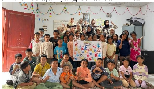
Gambar 2. Kegiatan Pojok Baca dan Storytelling

Program KKN di Desa Kutabelin dalam bidang pendidikan berfokus pada peningkatan literasi dan pembentukan karakter siswa. Mahasiswa menghadirkan kegiatan yang mendorong anak-anak lebih dekat dengan buku sekaligus menanamkan nilai-nilai sosial yang positif. Langkah ini menjadi salah satu strategi penting untuk menjawab tantangan rendahnya minat baca serta kurangnya pemahaman siswa mengenai perilaku belajar yang sehat dan inklusif.