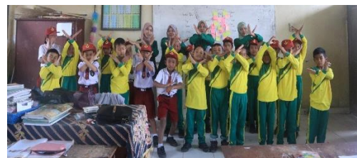
Gambar 3. Edukasi Anti-Bullying di SDN 048472

Terdapat dua program utama di bidang pendidikan. Pertama, Pojok Baca dan Storytelling yang bertujuan menumbuhkan minat baca siswa sejak dini sekaligus mengasah imajinasi mereka melalui cerita. Program ini mendapat respons positif karena membuat anak-anak lebih antusias mengenal buku dan membiasakan diri dengan budaya literasi. Kedua, Edukasi Anti-Bullying yang dirancang untuk menanamkan nilai saling menghargai dan mencegah perilaku kekerasan di lingkungan sekolah. Kegiatan ini berhasil membangun kesadaran siswa akan pentingnya sikap empati, kerja sama, dan perilaku inklusif. Kedua program ini memperlihatkan bahwa pendidikan berbasis literasi dan karakter menjadi fondasi penting untuk mencetak generasi yang cerdas dan berakhlak.