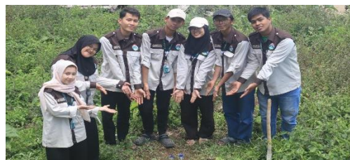
Gambar 11. Pembuatan biopori di Desa Kutambelin

Terdapat dua program utama. Pertama, sosialisasi internet sehat dan literasi digital yang ditujukan kepada siswa SD untuk memberikan pemahaman mengenai penggunaan media sosial secara bijak, pencegahan penyebaran hoaks, serta pemanfaatan internet sebagai sarana belajar dan pengetahuan. Kedua, pembuatan biopori sebagai teknologi ramah lingkungan, di mana siswa SD diajak secara langsung untuk mempraktikkan pembuatan lubang resapan sederhana. Kegiatan ini mengajarkan pentingnya menjaga lingkungan melalui inovasi yang mudah dilakukan, sekaligus membentuk kepedulian terhadap kelestarian alam sejak dini.