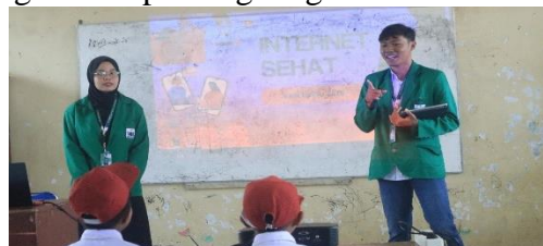
Gambar 10. Sosialisasi Internet Sehat

ramah lingkungan yang mudah dipahami oleh masyarakat, khususnya anak-anak sekolah dasar. Mahasiswa merancang kegiatan yang edukatif sekaligus aplikatif agar siswa dapat memahami manfaat teknologi sejak dini, baik dalam aspek digital maupun lingkungan.