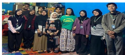
Gambar 7. Kegiatan Branding UMKM di Desa Kutambelin

Pendampingan UMKM difokuskan pada pembuatan logo, pengemasan produk, serta strategi promosi digital melalui media sosial. Kegiatan ini membantu pelaku usaha lokal memahami pentingnya identitas bisnis untuk menarik konsumen. Sementara itu, sosialisasi Bank Digital dan QRIS memperkenalkan metode pembayaran non-tunai yang praktis, aman, dan sesuai dengan tren transaksi modern. Sinergi kedua program ini memberi peluang besar bagi pelaku usaha desa untuk memperluas pasar sekaligus meningkatkan efisiensi transaksi, sehingga perekonomian desa Kutambelin dapat berkembang lebih adaptif terhadap era digital.