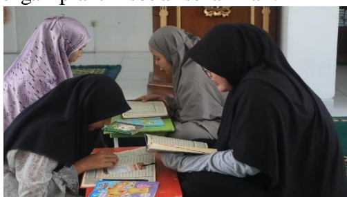
Gambar 8. Kegiatan Ngajibers (Ngaji Bersama)

mpererat solidaritas sosial. Mahasiswa merancang kegiatan yang tidak hanya memperdalam pemahaman agama, tetapi juga menumbuhkan nilai kebersamaan, gotong royong, serta kepedulian lingkungan. Melalui kegiatan ini, masyarakat diajak untuk membangun harmoni antara nilai-nilai keagamaan dengan praktik sosial sehari-hari.