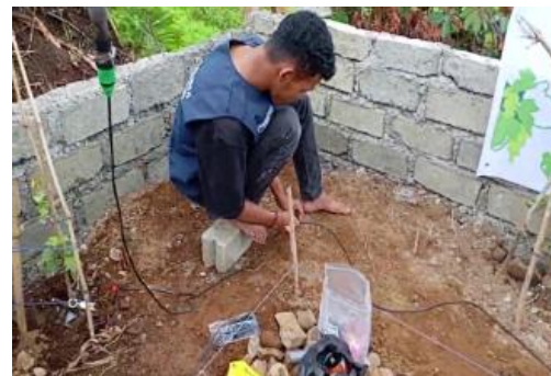
(b) Irigasi tetes