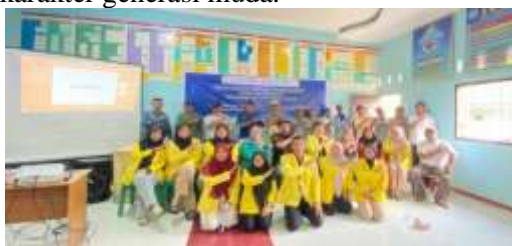
Gambar 1 Meningkatkan Motivasi Masyarakat dalam Membangun Karakter Anak di Masa Depan Melalui Pendidikan

Pelaksanaan acara tersebut berlangsung dengan mulus dan diwarnai oleh semangat yang tinggi. Peserta dari masyarakat terlihat sangat terlibat sepanjang proses sosialisasi, mulai dari pembukaan hingga penutupan. Narasumber menyajikan materi secara tatap muka, menyoroti urgensi dorongan motivasi dari orang tua untuk memperkuat pendidikan anak, kontribusi lingkungan sosial dalam menumbuhkan nilai-nilai karakter, serta pendekatan praktis untuk menumbuhkan tradisi belajar yang konstruktif di lingkup keluarga dan komunitas. Secara keseluruhan, kegiatan ini bersifat edukatif dan interaktif, dengan tingkat keterlibatan masyarakat yang mencerminkan minat mendalam terhadap isu-isu pendidikan serta pengembangan karakter generasi muda.