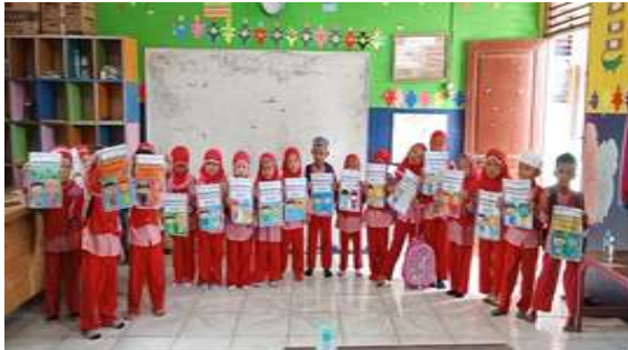
Gambar 3. Partisipasi aktif peserta dalam kegiatan diskusi serta praktik setelah pelatihan literasi digital

Berdasarkan survei yang dilakukan setelah pelaksanaan pelatihan ini, peserta pun memberikan komentar dan respon yang sangat positif. Hal ini dapat disimpulkan bahwa pelatihan bagaimana menulis surat lamaran berbahasa Inggris sangat bermanfaat.