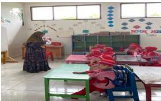
Gambar 1. Peserta dan tim pelaksana pada kegiatan pelatihan literasi digital melalui cerita bergambar

Para peserta yang mengikuti PKM ini adalah para siswa RA. Raudhatul Mahabbah Serdang Bedagai. Kegiatan ini dilakukan pada Jumat, tanggal 16-17 Oktober 2025. Kegiatan ini berlangsung selama ± 2 jam dimulai pukul 08.00 hingga 10.00 Wib, yang diikuti sebanyak 50 peserta. Media yang digunakan dalam PKM ini adalah buku cerita bergambar interaktif, video cerita dan banner.