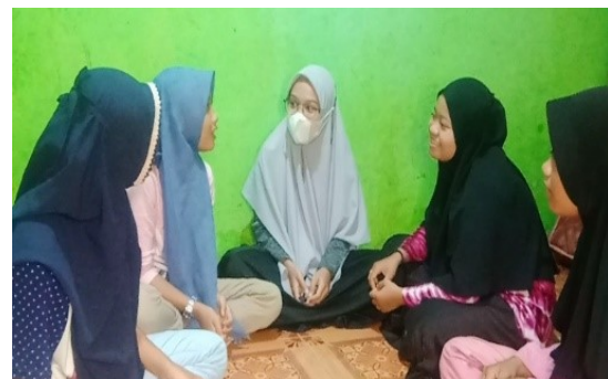
Gambar 2. Evaluasi Kegiatan

Tahap Evaluasi dan Terminasi yaitu tahapan pengidentifikasian atau pengukuran terhadap proses dan hasil kegiatan kelompok secara menyeluruh dan melihat berhasil atau tidaknya sebuah program berjalan. Serta tahapan terminasi yaitu pemutusan hubungan antara klien dan pendamping sesuai dengan hasil evaluasi.