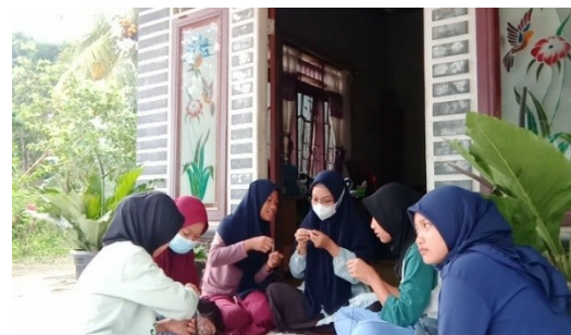
Gambar 1. Pemberian Pelatihan

sudah dilakukan dan perencanaan program apa yang akan dilakukan. Pada tahapan ini pendamping memberikan pengetahuan mengenai cara pembuatan strap masker dan konektor masker. Namun sebelum pelatihan dimulai pendamping terlebih dahulu memberikan arahan kepada peserta mengenai bahaya pergaulan bebas dan tindakan menyimpang lainnya serta dampak apa saja yang akan dirasakan jika terjerumus pada tindakan menyimpang.