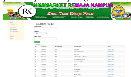
Gambar 3. Halaman Data Produk

Halaman ini terdapat form yang digunakan untuk menginput data produk ke sistem. Rancangan halaman data produk dapat dilihat pada gambar 3.