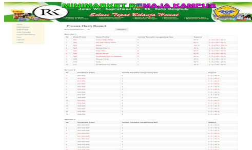
Gambar 5. Halaman Proses Hash-based

Pada gambar 5, secara nyata pada program aplikasi diperlihatkan tahap demi tahap yang terjadi selama analisa dengan menggunakan algoritma Hash-based sampai dengan kesiapan pelaporan yang diperlukan. Dimana tampilan laporan hasil proses Hash-based dimaksud dapat dilihat pada gambar 6.