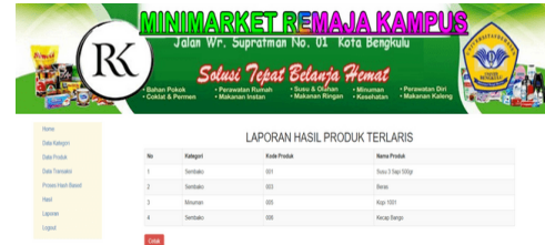
Gambar 7. Tampilan Barang Terlaris

Selain tampilan hasil proses hash-based seperti gambar 6, pemilik juga dapat mengetahui daftar barang terlaris selama kurun waktu tertentu. Adapun tampilannya seperti gambar 7.