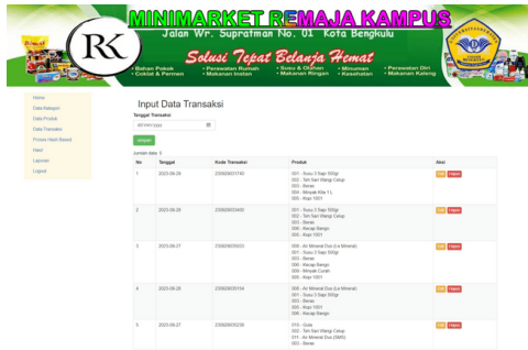
Gambar 4. Halaman Transaksi

Setelah pencatatan transaksi pembelian yang dilakukan oleh pelanggan telah mencapai volume data yang cukup, maka proses Analisa dengan Algoritma Hash-based dapat dilakukan dengan tampilan seperti terlihat pada gambar 5.