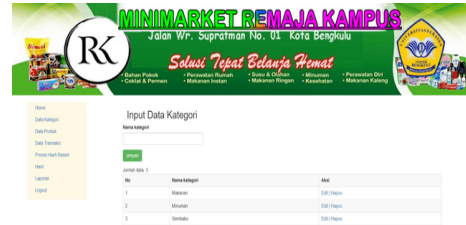
Gambar 2. Halaman Kategori

Halaman ini terdapat form yang digunakan untuk menginput data produk ke sistem. Rancangan halaman data produk dapat dilihat pada gambar 2.