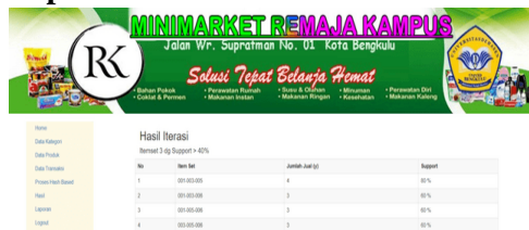
Gambar 6. Tampilan Laporan

Selain tampilan hasil proses hash-based seperti gambar 6, pemilik juga dapat mengetahui daftar barang terlaris selama kurun waktu tertentu. Adapun tampilannya seperti gambar 7.