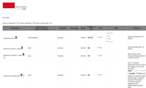
Gambar 3 Tampilan jendela baru pada webdriver

Pencarian spesies tanaman di Indonesia dapat dilakukan dengan mengklik simbol negara Indonesia pada situs. Pencarian dilakukan dengan Selenium dengan webdriver google chrome. Kemudian Selenium melakukan klik otomatis pada situs dengan mencari XPATH simbol negara Indonesia. XPATH negara Indonesia: “/html/body/table[2]/tbody/tr[168]/td[8]/a/img”. Hasil klik otomatis Selenium menghasilkan jendela baru pada webdriver yang dirincikan pada Gambar 3.