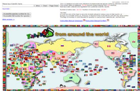
Gambar 2 tampilan awal situs knapsack world

menunjukkan tampilan awal halaman situs.