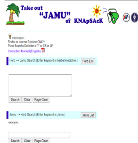
Gambar 5 Tampilan awal situs KnapSack jamu.

Pencarian tanaman herbal untuk jamu Pencarian tanaman herbal yang digunakan untuk pembuatan jamu dilakukan pada situs KnapSack jamu ( http://www.knapsackfamily.com/jamu/top.php ). Tampilan awal situs dapat dilihat pada Gambar 5.