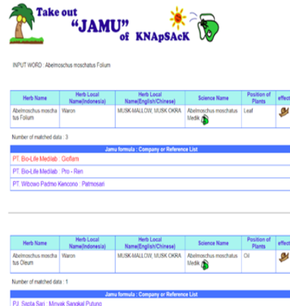
Gambar 6 Tampilan hasil pencarian jamu untuk tanaman herbal waron (Abelmoschus moschatus Folium)

Pencarian dimulai dengan mengklik tombol Herb List yang akan menampilkan seluruh tanaman herbal yang menjadi bahan jamu. Kemudian pilih satu per satu tanaman herbal dan tekan tombol search untuk mencari jamu yang berhubungan dengan tanaman tersebut. Terdapat 1133 tanaman herbal yang diproses menjadi jamu pada situs KNApSack. Contoh hasil pencarian dapat dilihat pada Gambar 6.