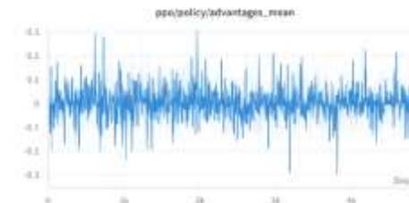
Gambar 1 Log Advantages

Notebook , dengan waktu pelatihan sekitar ~9 jam untuk 1 epoch . Random seed diatur pada nilai 42 untuk memastikan reproducibility pelatihan. Selama proses pelatihan, semua log / metrik akan di catat per step mulai dari loss , reward dan advantage yang diterima.