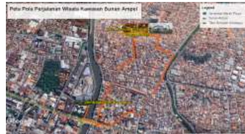
Gambar 12 Peta Perjalanan Wisata Kawasan Sunan Ampel

Pengelolaan yang lebih terstruktur dan kolaboratif akan memungkinkan tercapainya keseimbangan antara aspek keagamaan, komersial, dan sosial. Oleh karena itu, peta ini juga memberikan gambaran tentang pentingnya perencanaan ruang yang lebih holistik dan inklusif.