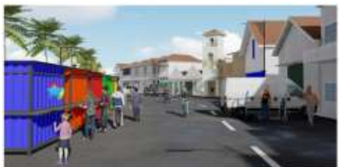
Gambar 6 Ilustrasi Suasana Jl. Kalimas Utara dengan Stall

Peran masyarakat lokal sangat besar dalam mengelola kawasan secara informal. Mereka turut mengatur lalu lintas peziarah, memandu arah ziarah melalui jalur subtrack , serta menjaga kebersihan dan keamanan. Gambar 6 menunjukkan bagaimana masyarakat mengelola lapak dagang secara spontan di Jl. Kalimas Utara.