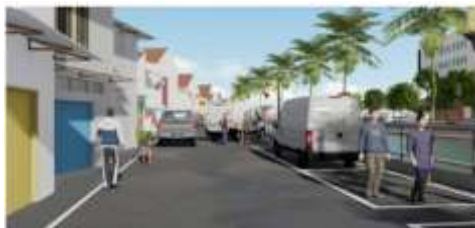
Gambar 1 Ilustrasi Parkir Jl. Kalimas Utara

Gambar 1 menunjukkan kondisi parkir di Jl. Kalimas Utara yang tidak tertata, menambah kesemrawutan.