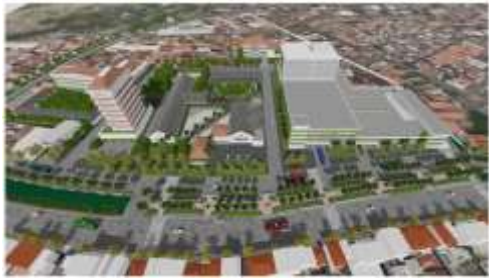
Gambar 5 Ilustrasi Perencanaan Lahan Ex-RPH Pegirian

Gambar 5 memperlihatkan perencanaan lahan Ex-RPH Pegirian yang dialihkan untuk fungsi baru. Hal ini menunjukkan kecenderungan konversi fungsi tanpa pengendalian spasial berbasis heritage.