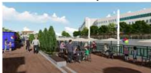
Gambar 9 Ilustrasi View Deck dan Area Makan Dermaga

Selain itu, pemanfaatan ruang yang lebih efisien dapat mendukung pencapaian tujuan keberlanjutan jangka panjang. Kolaborasi antara semua pihak, termasuk masyarakat, pemerintah, dan sektor swasta, sangat penting untuk memastikan pengelolaan kawasan yang lebih holistik dan berkelanjutan.