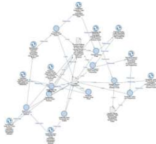
Gambar 7 Peta Kode Tematik Pengelolaan Spasial Kawasan Cagar Budaya Sunan Ampel

Hal ini menunjukkan bahwa penataan ruang yang tidak optimal dapat meningkatkan kepadatan dan mempengaruhi kualitas interaksi antar pengguna kawasan. Dengan memperbaiki alur pergerakan dan pemanfaatan ruang, diharapkan interaksi antar pengguna menjadi lebih harmonis. Oleh karena itu, penting untuk melakukan evaluasi dan perencanaan ulang terhadap tata letak dan penggunaan lahan yang ada.