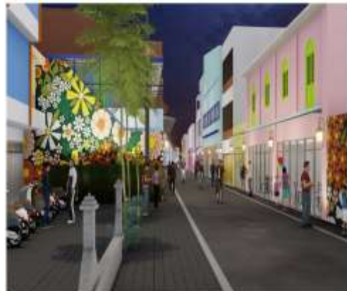
Gambar 3 Ilustrasi Suasana Jl. Panggung Malam Hari

Kawasan ini menunjukkan keberagaman fungsi lahan: keagamaan (Masjid dan Makam Sunan Ampel), perdagangan (souvenir, makanan), residensial, dan pendidikan (madrasah, pesantren). Namun, tidak adanya zonasi tegas menyebabkan tumpang tindih fungsi.