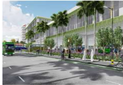
Gambar 2 Ilustrasi Gedung Parkir Bis dan Komunal

Gambar 2 menyajikan rencana pembangunan gedung parkir bis dan fasilitas komunal yang diharapkan dapat mereduksi kepadatan. Aksesibilitas kawasan masih terganggu oleh sempitnya ruas jalan dan dominasi pedagang kaki lima. Solusi informal seperti subtrack di gang-gang alternatif terbukti membantu peziarah menghindari kemacetan, namun belum didukung regulasi resmi.