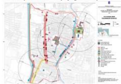
Gambar 11 Peta Rencana Umum Pengembangan Pariwisata

Node “Perubahan Lahan” dalam NVivo memiliki hubungan kuat dengan “Dampak Ekonomi” dan “Penataan Ruang Publik”, menandakan bahwa pergeseran nilai spasial tidak hanya berdampak fisik tetapi juga budaya.