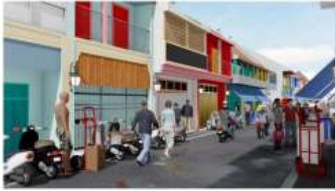
Gambar 4 Ilustrasi Suasana Jl. Pangung Siang Hari

aktivitas ekonomi bahkan di zona religius.