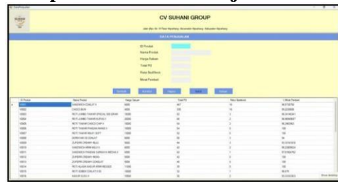
Gambar 3 Tampilan Menu Data Penjualan