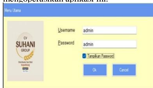
Gambar 1 Menu Login

Untuk dapat menggunakan atau mengoperasikan aplikasi ini.