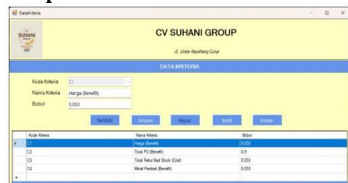
Gambar 4 Tampilan Menu Data Kriteria