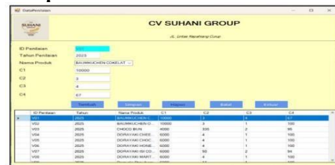
Gambar 5 Tampilan Menu Data Penilaian