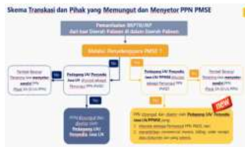
Gambar 6 Skema Transaksi dan pihak yang memungut dan menyetor PPN PMSE

Dari skema alur transaksi PMSE diatas, dapat disimpulkan bahwa subjek pemungut PPN PMSE adalah pelaku usaha PMSE yang terdiri dari (a) pedagang luar negeri; (b) penyedia jasa luar negeri; (c) penyelenggara PMSE luar negeri dan/atau (d) penyelenggara PMSE dalam negeri yang telah ditunjuk oleh Menteri Keuangan sebagai pemungut PPN PMSE. Dan transaksinya meliputi Business-to-Business (B2B) dan Business-to-Consumer (B2C). . Pelaku usaha di bidang e-Commerce wajib untuk memungut PPN atas produk yang