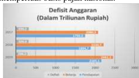
Gambar 3 Defisit Anggaran Berdasarkan Laporan APBN

Implikasi pandemi COVID-19 berdampak pada perlambatan ekonomi nasional, penurunan penerimaan, dan peningkatan belanja negara. Untuk mengatasinya, pemerintah mengeluarkan kebijakan dan paket stimulus, termasuk insentif pajak seperti PPh 21 DTP, penurunan tarif PPh Badan, pembebasan PPh 22 impor, serta pembebasan pajak atas impor alat kesehatan dan vaksin. Stimulus ini memicu defisit anggaran karena penerimaan pajak turun sementara belanja meningkat. Oleh karena itu, pemerintah mencari sumber penerimaan pajak baru yang potensial dan berkelanjutan, salah satunya melalui penerapan PPN atas Perdagangan Melalui Sistem Elektronik (PMSE) yang tumbuh pesat selama pandemi sebagai upaya memperluas basis pajak nasional.