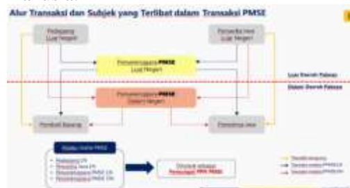
Gambar 5 Alur Transaksi dan Subjek yang terlibat transaksi PMSE

umumnya, dengan penyesuaian untuk konteks operasional internasional, Objek PPN dalam skema PMSE mencakup Barang Kena Pajak (BKP) Tidak Berwujud seperti barang digital-termasuk perangkat lunak, multimedia, dan data elektronik-serta Jasa Kena Pajak (JKP) seperti jasa digital yang dikirim secara otomatis melalui jaringan elektronik dan hanya melibatkan sedikit campur tangan manusia.