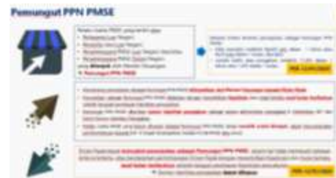
Gambar 7 Pemungut PPN PMSE

bidang e-commerce juga wajib untuk mencantumkan pungutan pajak dalam invoice .