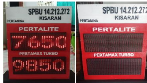
Gambar . Panel P10

Pengujian ini dilakukan untuk mengetahui kinerja dari panel P10 ketika penginputan harga BBM dilakukan menggunakan aplikasi blynk yang masing-masing sudah terhubung dengan sebuah internet yang berbeda, jika NodeMCU berhasil merespon maka panel P10 akan menampilkan hasil yang sudah di inputkan sesuai dengan aplikasi, jika tidak merespon maka panel P10 tidak akan menampilkan hasil secara update.