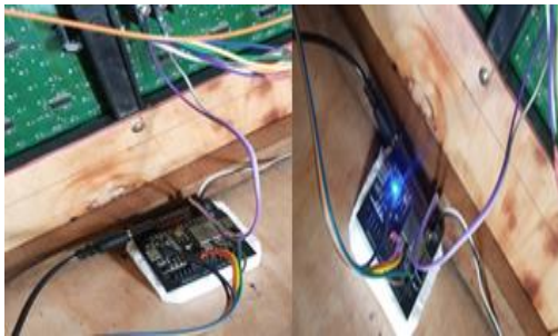
Gambar . NodeMCU

Pengujian sistem NodeMCU ini dilakukan untuk mengetahui keluaran yang akan dihasilkan apakah sesuai dengan program yang dibuat. Dengan dilakukan dengan cara memprogram NodeMCU dengan sistem yang sudah kita rancang, karena NodeMCU diprogram sebagai microcontroller sekaligus sebagai penghubung dengan blynk maka pengujian berhasil.