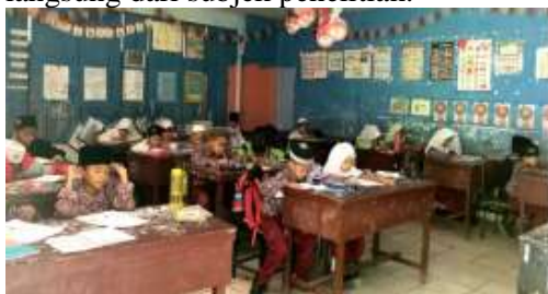
Gambar 1 Proses pengerjaan instrumen tes mengenai ciri-ciri bangun datar oleh siswa

deskriptif. Pendekatan ini dipilih karena peneliti ingin mendeskripsikan dan menjelaskan secara mendalam mengenai tingkat pemahaman siswa tanpa menggunakan perhitungan statistik yang rumit. Melalui metode deskriptif, peneliti akan menggambarkan bagaimana cara siswa mengenali, mengelompokkan, dan memahami ciri-ciri bangun datar melalui benda-benda nyata yang mereka temui sehari-hari. Data yang dikumpulkan mengutamakan kualitas informasi berupa kata-kata, tindakan, dan penjelasan langsung dari subjek penelitian.