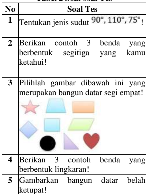
Tabel 2 Soal-soal Tes

Kemampuan pemahaman konsep matematika siswa dapat diidentifikasi melalui ketepatan tahapan penyelesaian masalah yang dilakukan secara sistematis. Penelitian ini melibatkan 25 siswa kelas 3 MIS Saksi Tanjung Balai sebagai subjek