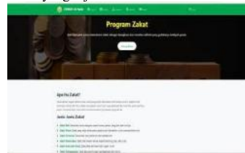
Gambar 6 Tampilan menu kontrol relay

Tampilan Halaman Tentang pada website ZISWAF Al-Falah memuat penjelasan mengenai visi, dan misi lembaga sebagai landasan arah gerakan sosial yang dijalankan.