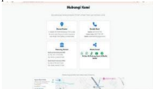
Gambar 10 Tampilan Halaman Kontak

Tampilan Halaman Kalkulator Zakat pada website ZISWAF Al-Falah dirancang sebagai fitur interaktif yang membantu pengguna menghitung estimasi kewajiban zakat secara mandiri dan praktis