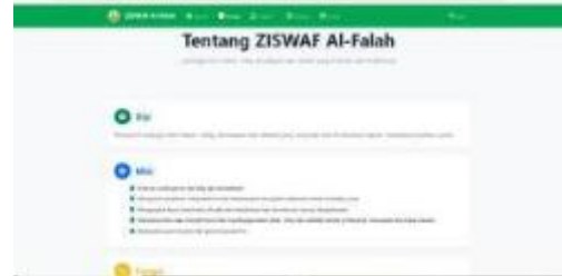
Gambar 5 Tampilan halaman tentang

Tampilan halaman Beranda website ZISWAF Al-Falah dirancang sebagai pintu masuk utama pengguna langsung disambut dengan banner visual yang merepresentasikan aktivitas pendidikan dan kepedulian sosial, disertai judul utama serta ajakan untuk berkontribusi melalui zakat, infak, sedekah, dan wakaf.