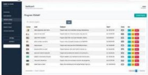
Gambar 15 Tampilan Kelola Program ZISWAF

Tampilan Halaman Dashboard Admin pada sistem ZISWAF Al-Falah merupakan pusat kendali utama bagi pengelola dalam memantau dan mengelola seluruh aktivitas website.