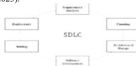
Gambar 1 Metode SDLC

Penelitian ini menggunakan metode pengembangan perangkat lunak ( Software Development Life Cycle/SDLC ) untuk merancang dan membangun sistem informasi ZISWAF Al-Falah berbasis website. SDLC dipilih karena menyediakan tahapan terstruktur mulai dari analisis kebutuhan, perancangan, implementasi, hingga pengujian dan pemeliharaan sistem, sehingga menghasilkan aplikasi yang berkualitas dan sesuai tujuan lembaga. Dalam konteks sistem informasi berbasis web, metode SDLC banyak digunakan untuk memastikan sistem yang dikembangkan memenuhi kebutuhan pengguna dan mudah dipelihara (Widya & Habibah, 2023).