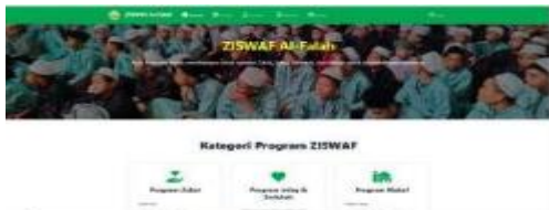
Gambar 4 Tampilan Halaman Beranda

Halaman Login Akun pada sistem informasi ZISWAF Al-Falah yang berfungsi sebagai gerbang autentikasi bagi pengguna sebelum mengakses fitur tertentu. Pada bagian tengah halaman terdapat formulir login yang meminta Email atau Nomor Telepon serta Password, dilengkapi opsi “Ingat saya” untuk mempermudah akses berikutnya. Tersedia juga tombol Login sebagai aksi utama bagi pengguna yang belum memiliki akun.