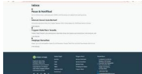
Gambar 11 Tampilan Halaman Inbox

Tampilan Halaman Kontak pada website ZISWAF Al-Falah berperan sebagai pusat informasi komunikasi yang menghubungkan lembaga dengan masyarakat.