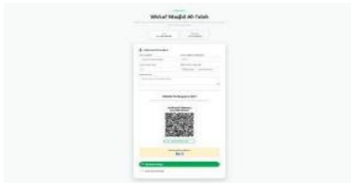
Gambar 8 Tampilan notifikasi bot Telegram

Halaman Form Donasi Wakaf Masjid Al-Falah dirancang sederhana dan mudah digunakan untuk memudahkan donatur menyalurkan wakaf. Form informasi donatur yang mencakup nama lengkap, nomor telepon (WhatsApp), jumlah donasi, serta pesan atau doa. Donatur dapat langsung melakukan pembayaran melalui metode QRIS yang tersedia dengan men-scan kode QR.