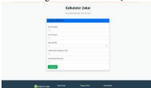
Gambar 9 Tampilan halaman kalkulator

Halaman Form Donasi Wakaf Masjid Al-Falah dirancang sederhana dan mudah digunakan untuk memudahkan donatur menyalurkan wakaf. Form informasi donatur yang mencakup nama lengkap, nomor telepon (WhatsApp), jumlah donasi, serta pesan atau doa. Donatur dapat langsung melakukan pembayaran melalui metode QRIS yang tersedia dengan men-scan kode QR.