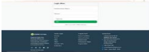
Gambar 3 Tampilan Halaman login

Tampilan visual disajikan untuk menunjukkan hasil implementasi sistem informasi ZISWAF Al-Falah yang telah dikembangkan, khususnya pada bagian antarmuka web.