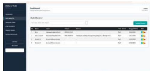
Gambar 14 Tampilan Halaman Data

Tampilan Halaman Login Admin pada website ZISWAF Al-Falah berfungsi sebagai pintu akses khusus bagi pengelola sistem untuk masuk ke dalam dashboard administrasi.