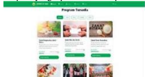
Gambar 7 Tampilan Halaman Program

Halaman Informasi Program pada website ZISWAF Al-Falah menampilkan daftar program yang tersedia dalam satu tampilan yang rapi dan mudah dipahami.