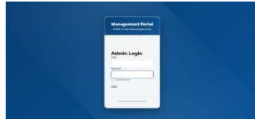
Gambar 13 Tampilan Halaman Login Admin

Tampilan Halaman Profil User pada website ZISWAF Al-Falah merupakan halaman yang menampilkan data pribadi pengguna yang telah terdaftar dalam sistem.