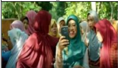
Pakaian, perhiasan, barang bawaan ibu-ibu

Memberikan bantuan/sumbangan/kepedulian sosial.