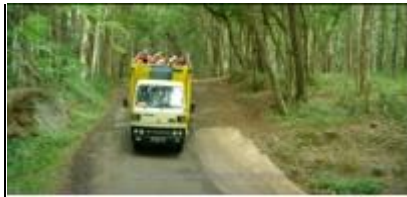
Truk bak terbuka yang dipakai sebagai kendaraan menjenguk