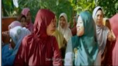
Obrolan ibu-ibu tentang Dian

Mereka membicarakan tentang status sosial, tentang apa yang dianggap “tidak benar” / rumor.