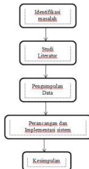
Gambar 1 Metode Penelitian

Metodologi penelitian yang baik akan menghasilkan paradigma yang baru dalam pengembangan ilmu pengetahuan(Negeri et al. 2024). Penelitian ini menggunakan metode kualitatif dengan pendekatan system pakar untuk menganalisis data penyakit jantung dan pembuluh darah. Di bawah ini merupakan gambar tahapan dari penelitian: