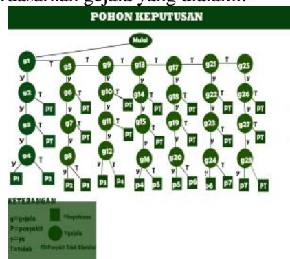
Gambar 2 Pohon keputusan

pendukung keputusan untuk membantu mengidentifikasi jenis penyakit jantung berdasarkan gejala yang dialami.