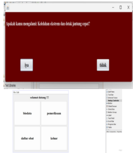
Gambar 4 Halaman Utama

Pada halaman Ini pasien atau pengguna harus melakukan registrasi terlebih dahulu sebelum masuk ke menu berikutnya, seperti pada gambar di bawah ini: