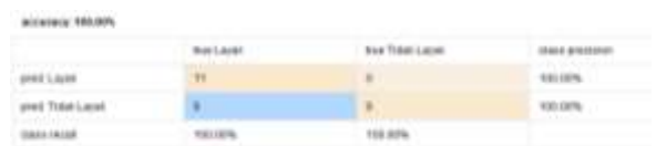
Gambar 2. Akurasi pada Rapid Miner

Dari tabel 12 di atas, dapat dilihat dari 20 data warga, 11 warga dinyatakan layak menerima bantuan PKH dan 9 warga dinyatakan tidak layak menerima bantuan PKH. Untuk menguji tingkat keakuratan data dari hasil klasifikasi tersebut, maka penelitian ini menggunakan teknik confusion matrix dan Rapid Miner [13]. Dapat dilihat pada Gambar 2 berikut.